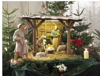
Foto: Krippe im St. Hedwig-Krankenhaus

Wenn die Weihnachtsskrippe genau nach den biblischen Erzählungen aufgebaut wird, dann sieht sie unterschiedlich aus, je nachdem ob man das Matthäus-Evangelium oder das Lukas-Evangelium zur Grundlage nimmt. Die Teilnehmerinnen beim FrauenBibelFrühstück am 7. Dezember nahmen die Texte genau unter die Lupe und konnten in den altbekannten Erzählungen manches Neue entdecken, z.B. dass der einfache Satz, dass in der Herberge kein Platz für Maria und Josef war, bedeutet, dass sie vermutlich in das Zuhause einer Familie aufgenommen wurden. In den damals üblichen Häusern lebten Menschen und Vieh unter einem Dach, deshalb wurde das Kind in die Krippe gelegt. Maria und Josef wurden nicht abgewiesen, sondern erfuhren Solidarität.